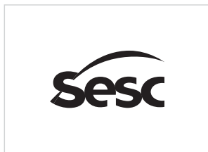
versão monocromática positiva

A marca monocromática deve ser aplicada exclusivamente nas cores preto (versão positiva) ou branco (versão negativa) ou azul Sesc (sobre fundo branco) , pois qualquer outra cor pode comprometer a caracterização da identidade visual.