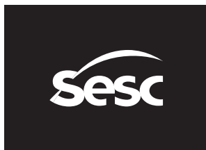
versão monocromática negativa