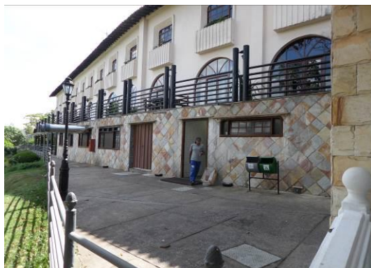
Figura 05 – Vista geral da Pousada