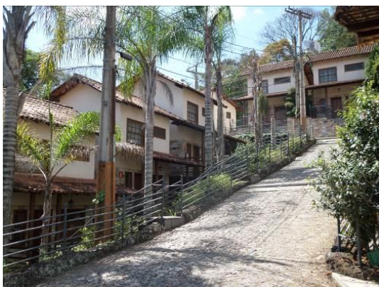
Figura 13 – Vista Bangalôs