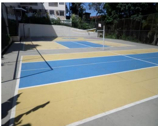
Figura 09 – Vista Geral das Quadras