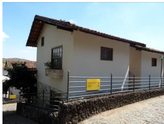
Figura 14 – Vista Bangalôs