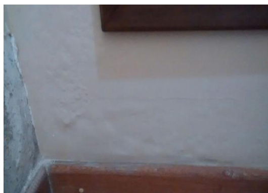
Figura 08 – Vista Desgaste de UH