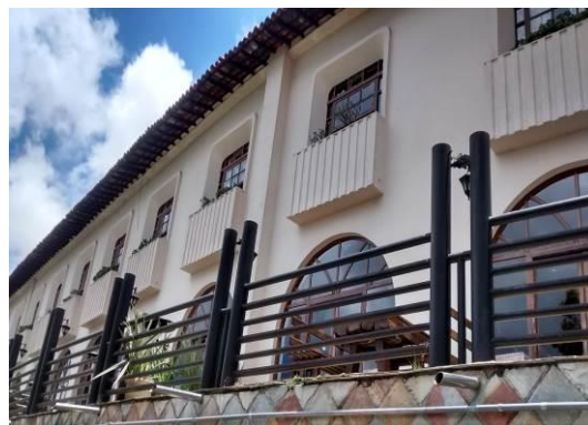
Figura 06 – Vista Desgaste das Quadras