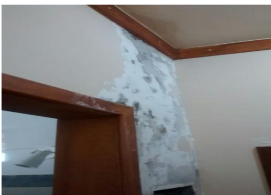
Figura 07 – Vista interna de UH