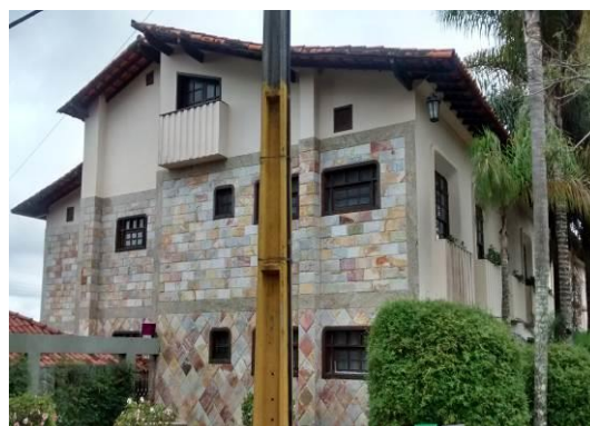
Figura 04 – Vista geral da Pousada