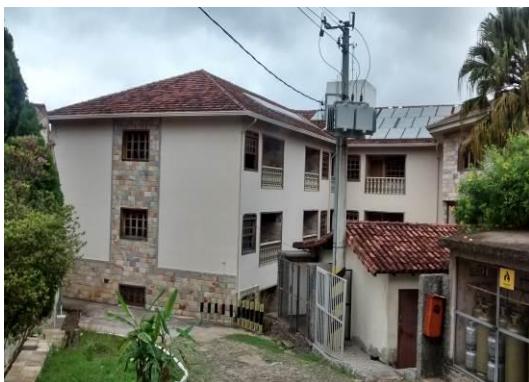
Figura 01 – Vista geral da Pousada.

2.2. Abaixo algumas fotos da unidade Sesc Ouro Preto: