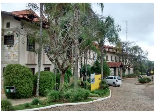
Figura 03 – Vista geral da Pousada