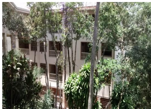
Figura 02 – Vista geral da Pousada