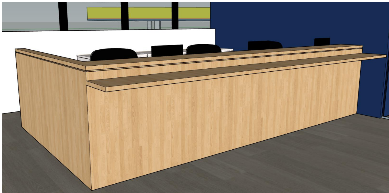
Figura 1 – Imagem 3D