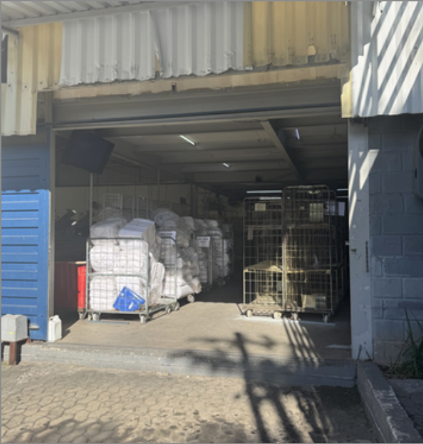
Entrada específica para os veículos.

Área composta por pesagem/contagem e lavagem de roupa suja compatível com o volume de roupa recebido.