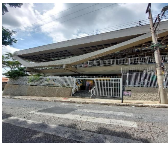
Foto03: Frente da unidade.